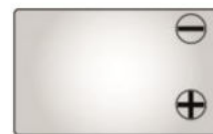
Тип клемм F2